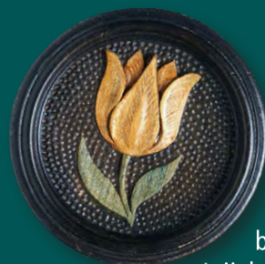
Hrací kámen s květem tulipánu Adam Eck (připisováno), 40. léta 17. století Pasoldova sbírka