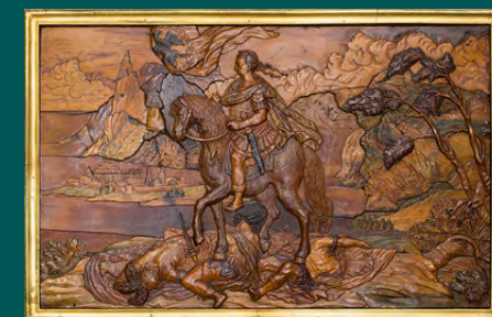
Julius Caesar jako vládce světů Haberstumpfova dílna, 20. léta 18. století Soukromá sbírka

Koncepci výstavy „Umělecká všehochuť – Reliéfní intarzie z Chebu“ vypracovalo Sudetoněmecké muzeum. Nyní je možné ji v lehce pozměněné podobě zhlédnout v Muzeu Chebska. K výstavě nabízíme pestrý doprovodný program. Workshopy a akce jsou zaměřeny i přeshraničně a jsou určeny německým i českým zájemcům.