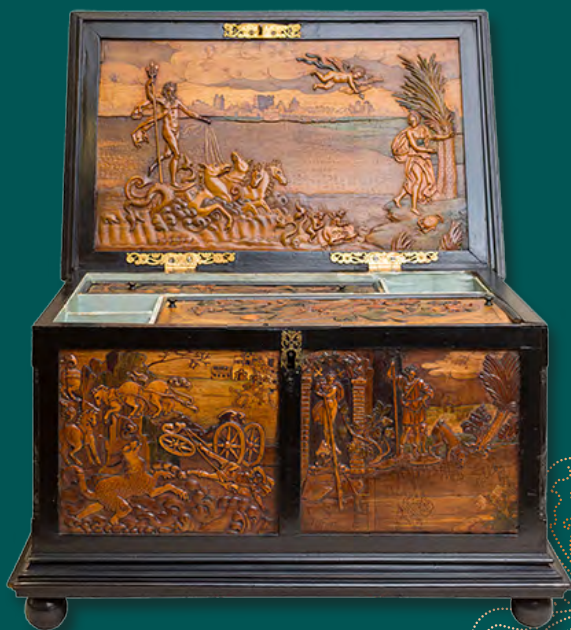
Šperkovnice Neznámý mistr, ca. 1635–1642 Pasoldova sbírka

Reliéfní intarzie představují zvláštní formu trojrozměrných intarzií. Jsou považovány za kunsthistorickou raritu. Vyráběny byly v 17. a na počátku 18. století výlučně v Chebu (dříve Eger). Fascinuje na nich virtuózní řezbářská technika a nesmírně pečlivé znázornění detailů pomocí vkládaných prvků s mikroskopickými rozměry. To těmto kusům nábytku, kabinetním skříním, šperkovnicím, deskovým hrám a obrazovým deskám propůjčuje neobyčejný estetický ráz a atraktivitu.