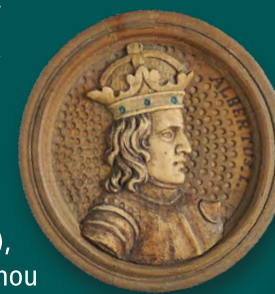
Hrací kámen s portrétem sv. Adalberta Magdeburského Adam Eck (připisováno), 40. léta 17. století Soukromá sbírka